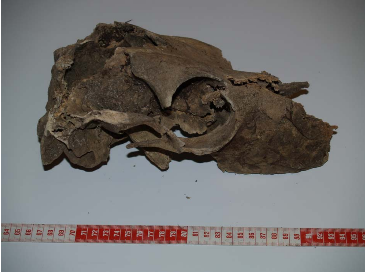
Storfekranium funnet Hulderholene 17/10 2007